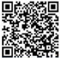
คลิกสำรวจความรู้สึกของนักเรียน