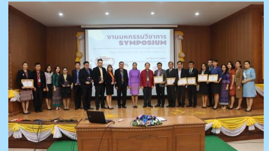
จัดมหกรรมวิชาการ SYMPOSIUM