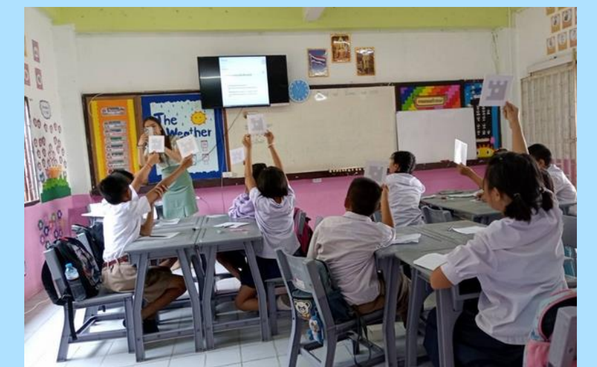
การนิเทศในชั้นเรียน