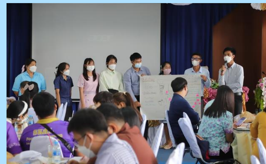
จัดกิจกรรมแลกเปลี่ยนเรียนรู้ (PLC)