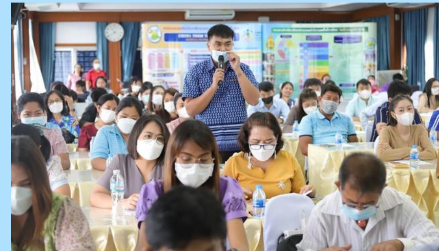
จัดการอบรม พัฒนาครูเพิ่มเติม