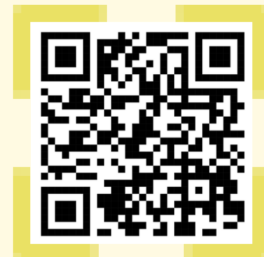
หนังสือถึง สพร.

สพร. จัดสรรงบประมาณ ให้ สพร. 245 เขตฯ ละ 40,000 บาท