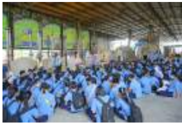
นักเรียนเรียนรู้ และปฏิบัติกิจกรรมตามฐาน