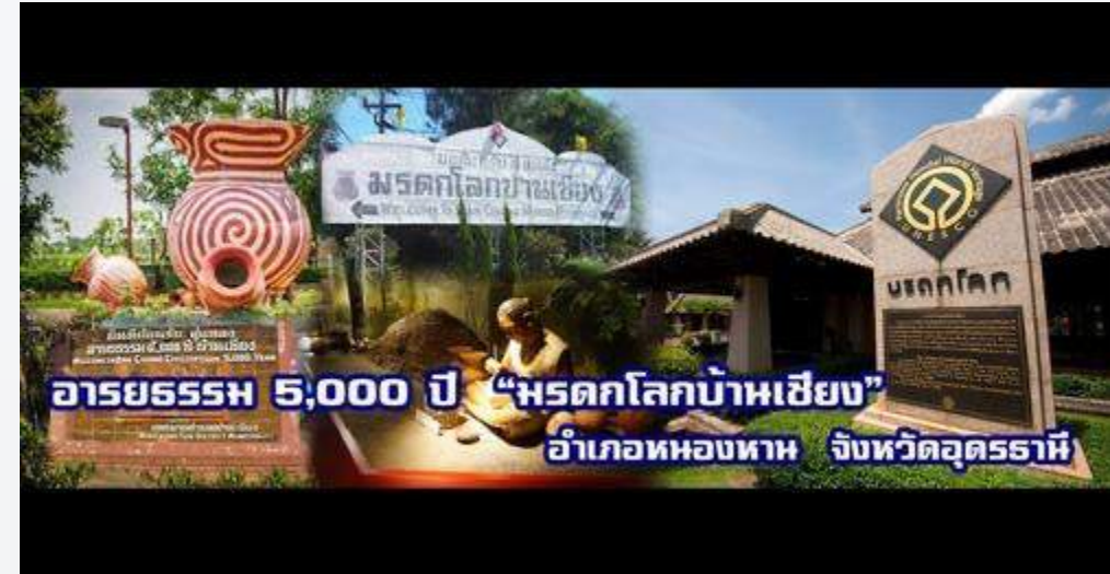
การบูรณาการแหล่งเรียนรู้ท้องถิ่น/ ประวัติศาสตร์ กับหลักสูตรสถานศึกษา >> อารยธรรมบ้านเชียงมรดกโลก 5,000 ปี <<