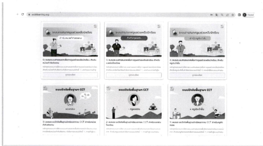
ภาพที่ 4 หน้าหลักสูตร

4. เลือกลงทะเบียนในหลักสูตรตามความรับผิดชอบของคุณครู ในแต่ละหลักสูตรประกอบด้วยแบบทดสอบก่อนเรียน (Pre-Test) บทเรียนแต่ละขั้นตอน และแบบทดสอบหลังเรียน (Post-Test) ในแบบทดสอบก่อนเรียนและหลังเรียนสามารถทำได้เพียงครั้งเดียว และมีเวลาดำหนดในการทำแบบทดสอบละ 20 นาที เมื่อทำแบบทดสอบผ่านเกณฑ์ 70% จะได้รับเกียรติบัตร