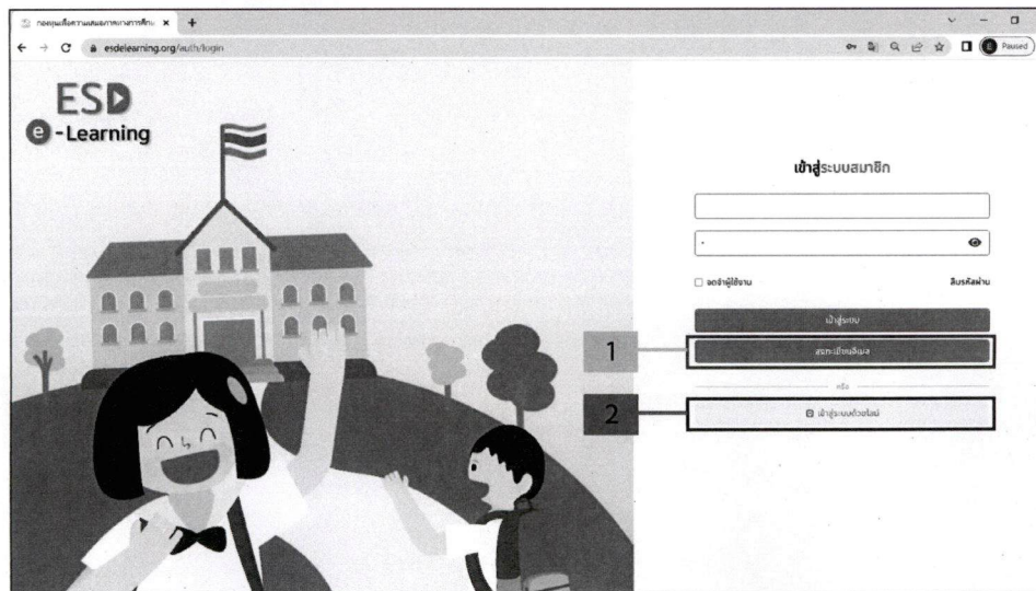
ภาพที่ 1 หน้าเข้าสู่ระบบสมาชิก

ในการเข้าใช้งานครั้งแรก ผู้ใช้สามารถเลือกช่องทางการเข้าใช้งาน ได้ 2 วิธี คือ