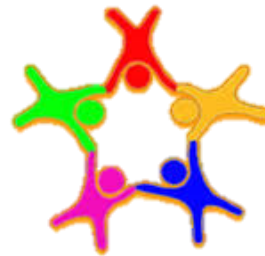
งานสภานักเรียน