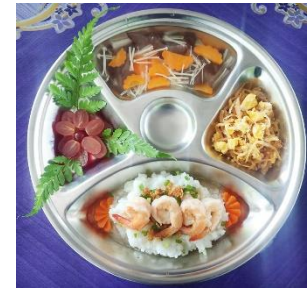
งานอาหารกลางวัน ( 21 บาท )