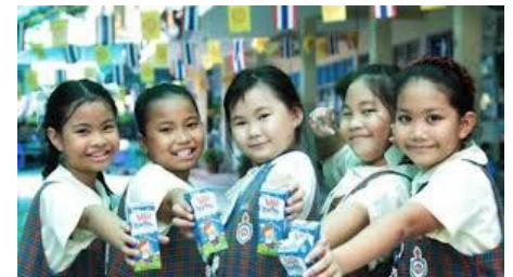
นม(โรงเรียน)