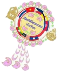
งานศิลปะหัตถกรรมนักเรียน