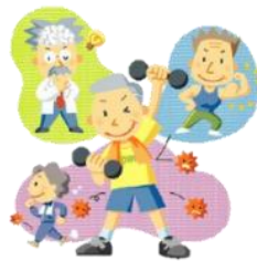
งานส่งเสริมสุขภาพ