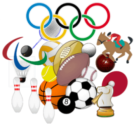
งานส่งเสริมกีฬา